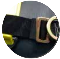
Cinta de pecho ajustable.