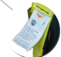
Indicador de caída.