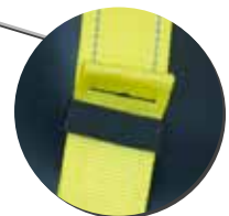
Clips retenedores de cinta para piernas, pecho y hombros.