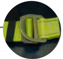
Argolla de ascenso y descenso en línea de vida vertical.