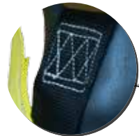
Cinta con resistencia estática de 4.082 kg (9.000 lbs).